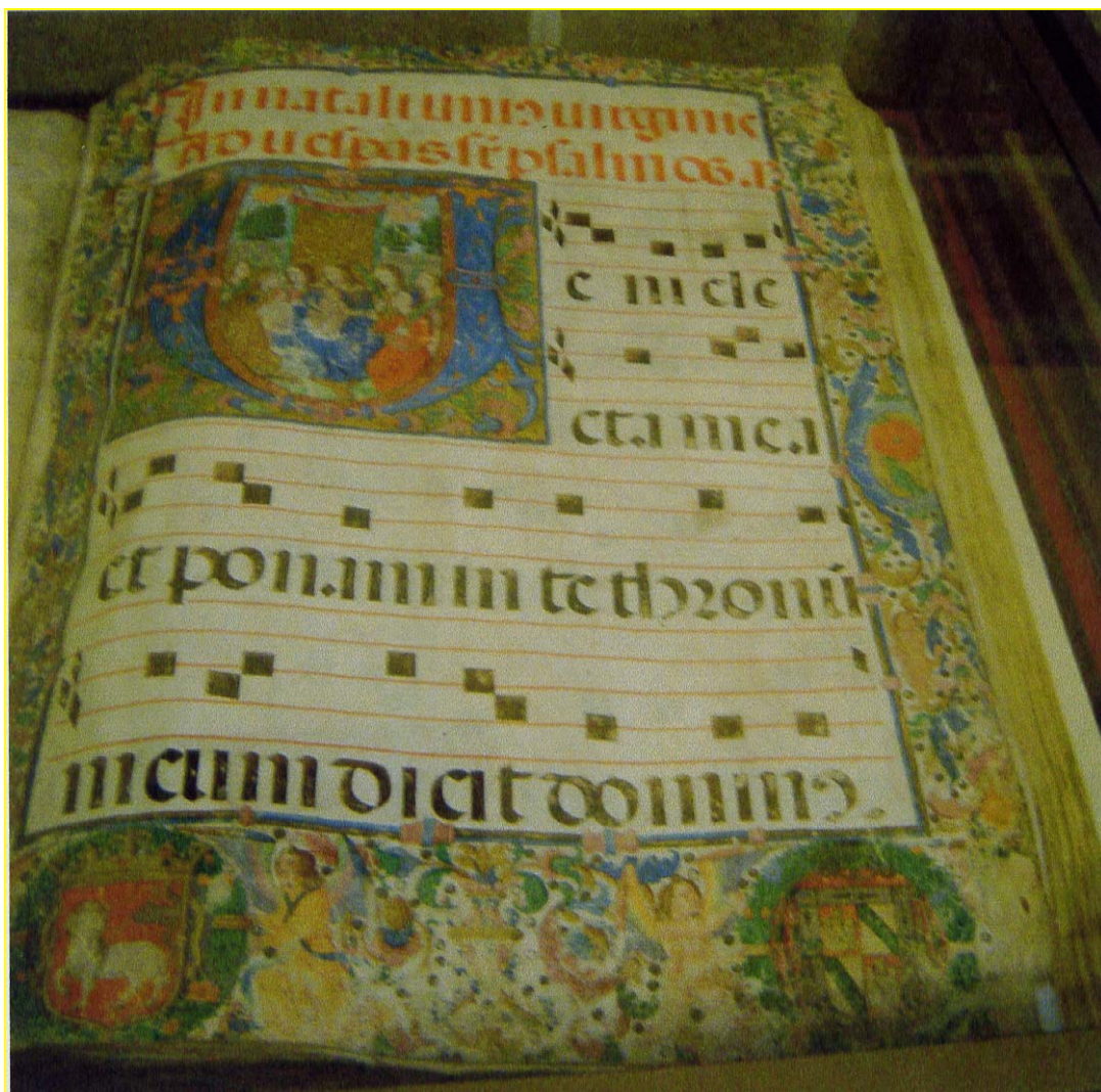
XII. Libro de coro. España siglo XVII.