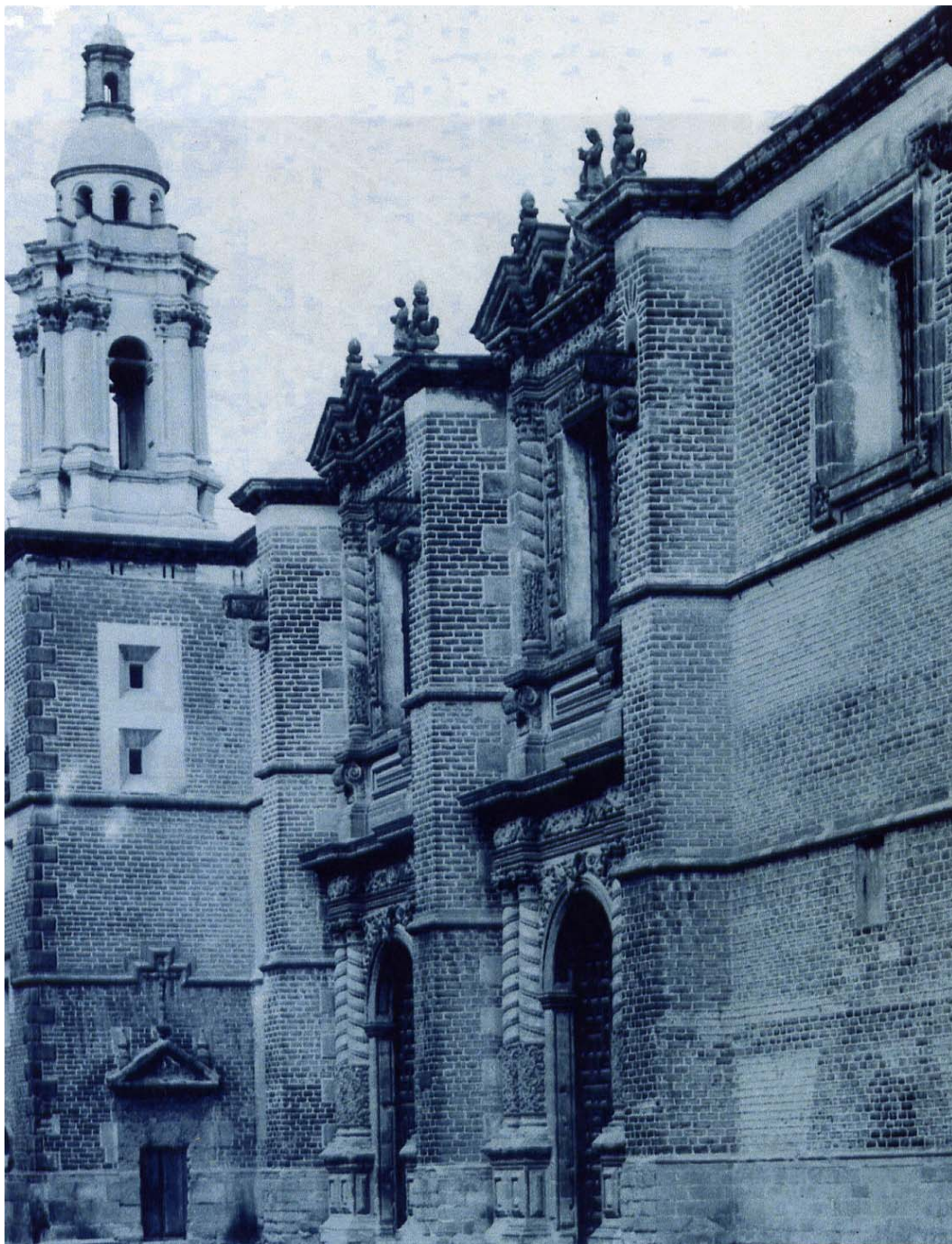
II. Vista general de la iglesia del convento de San José o Santa Teresa la Antigua. Fray Agustín de la Madre de Dios. Los Carmelitas Descalzos en la Nueva España del siglo XVII . Apéndice fotográfico.