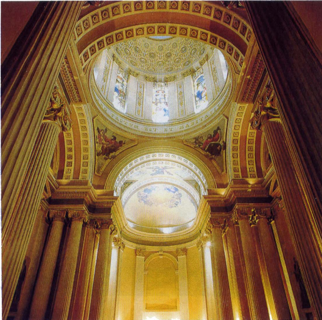
IV. Interior de la excapilla del Santo Cristo de Santa Teresa, del convento de San José o Santa Teresa la Antigua. Amerlinck de Cosi, Ma. Concepción, Ramos Medina, Manuel. Conventos de Monjas en el México virreinal , p. 105.