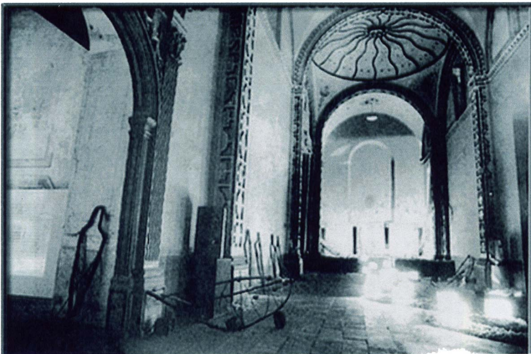
V. Interior del Templo del convento de San José o Santa Teresa la Antigua. Raymundo Sosma. "Festín en Mictlan". www.lattuastudio.it