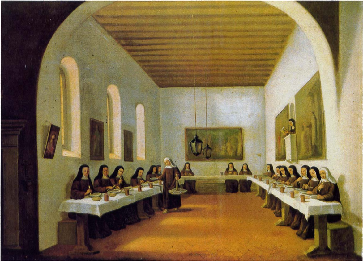
I. Refectorio de monjas Carmelitas. Anónimo, óleo sobre tela 84 x 97.7 cm. Museo Nacional del Virreinato. Monjas Coronadas. Vida Conventual femenina en Hispanoamérica , p. 104-105.