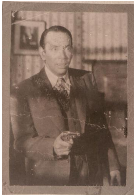
Miguel Ynclán en cine.