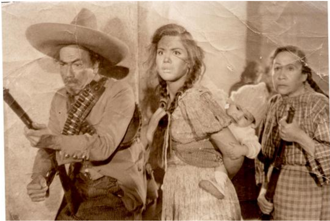
Miguel Yncán con Lilia Prado y Lupe Yncán en la película de Pedro Infante Las mujeres de mi general .