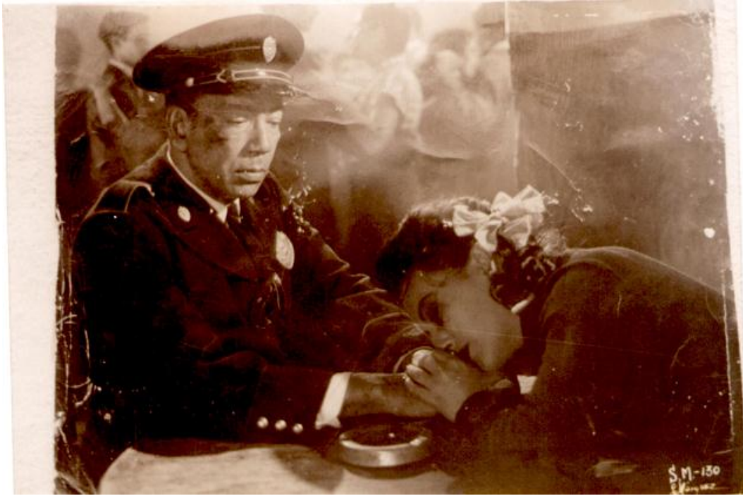
Miguel Yncán con Marga Lopéz en Salon México .