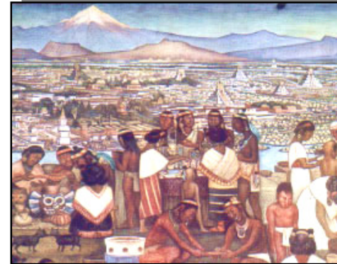
El nombre de Coyoacán proviene desde la época prehispánica.

A inicios del siglo XVII las aguas del lago colindante fueron disminuyendo paulatinamente. Las zonas pantanosas que se formaron disminuyeron gracias a la construcción de canales por lo que las tierras libres de agua se dedicaron a la agricultura trabajada por la población indígena. Varios ranchos y haciendas se instalaron en la zona desarrollando