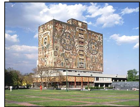
La construcción de la Universidad representa una etapa importante para la consolidación de Coyoacán.