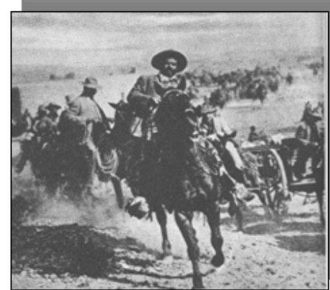
Desde la época post-revolucionaria, se va adquiriendo el carácter habitacional en la delegación.

Con la factibilidad de este mejoramiento vial surgieron colonias como Churubusco, Barrio San Lucas, La Concepción y Villa Coyoacán. Puede señalarse que a partir del establecimiento de estas colonias, la tendencia de ocupación espacial se dio hacia el sur. Esta delegación representó campo fértil para el desarrollo de grandes conjuntos habitacionales entre las décadas de 1950 y 1960, con la utilización de los predios para reserva por parte de importantes zonas habitacionales construidas por el INFONAVIT y otros organismos particulares.