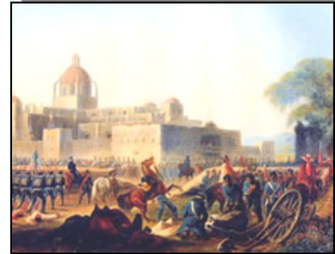
En Coyoacán también existieron pequeños movimientos de independencia.

En 1910, previo al inicio del movimiento revolucionario, Coyoacán, que apenas rebasaba los límites marcados por la antigua traza colonial, recibe del gobierno de Porfirio Díaz el Kiosco aún presente en la plaza Hidalgo.