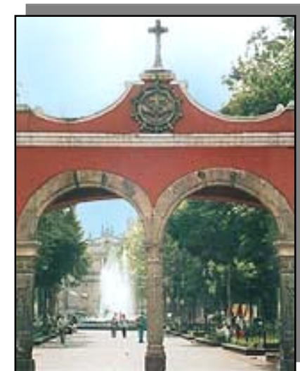
En los años 40 comienza el acelerado crecimiento urbano de la entidad.