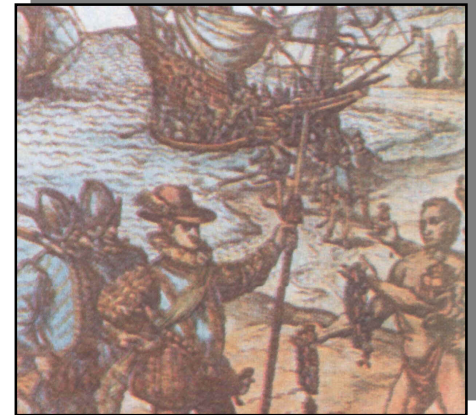
La delegación comenzó a obtener importancia y poder desde de la conquista.