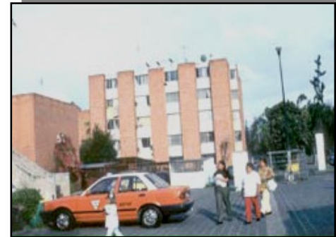
En los años 50 inicia la intensa construcción de unidades habitacionales en la zona oriente de la delegación.