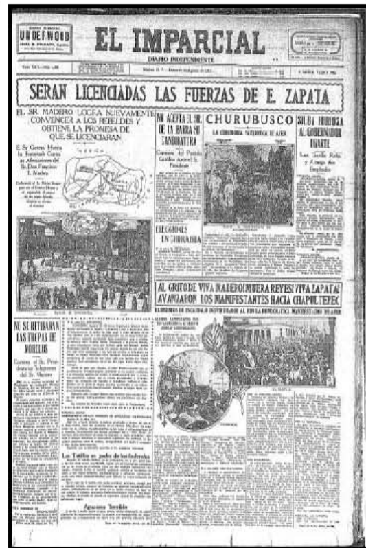
Imagen 2 Portadas de Periódicos Publicados en 1911 Tomadas de la HNDM.