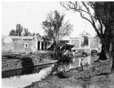
La antigua Garita de La Viga (1885) de William Henry Jackson. Este lugar se encontraba en el actual cruce de calzada de la viga y eje 3 sur chabacano.