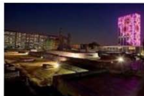
La Plaza de las Tres Culturas o, Tlatelolco.