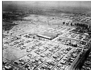
Vista aérea de la colonia Asturias a finales de los años 1930. El estadio de fútbol se encontraba en la actual avenida Chabacano.