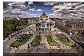
Palacio Nacional de las Bellas artes.