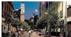
Calle Regina, Centro Histórico.