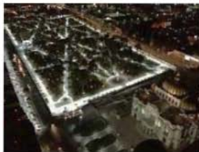
Alameda central, Centro Histórico.

En los últimos años se han implementado nuevos proyectos de rescate, estos comenzaron desde el centro de la ciudad, son enfocados al mejoramiento de espacios públicos y recreativos, así como proyectos urbanísticos de conexión, mediante corredores peatonales o por medio del transporte público. También se han rescatado edificaciones con un patrimonio cultural importante y generado nuevos espacios de difusión cultural.