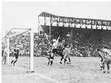
Aspecto de un partido en el estadio Asturias alrededor de 1936.

El 15 de octubre de 1907, el Ayuntamiento opinó que se aceptaba el fraccionamiento de calles y manzanas, sin que la aceptación significara anuencia para el establecimiento de la colonia. Finalmente no se celebró el contrato entre las partes. El 30 de marzo de 1913, la Compañía Agrícola y Colonizadora Mexicana, S.A. presentó un proyecto de contrato para la urbanización de la colonia, sin que se llegara a firmar documentación alguna en el que conste la autorización oficial respectiva, según el legajo Colonias (1890-1892) del Archivo del Ayuntamiento. En el plano de la Ciudad de México de 1920 la colonia aparece semi-integrada: el caserío se excedía al Hospital de Niños Expósitos. Sobre la parte norte y poniente, sobre todo a lo largo del Canal de la Viga, las casas estaban colocadas de manera irregular. Actualmente se encuentra dentro de la delegación Cuauhtémoc, con una población de 4 500 personas. ▶