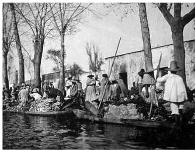
La Viga, entrada a la ciudad trajineras cargadas con legumbres, frutas, cereales, azúcar, aguardiente y demás productos de tierra caliente para el abasto de la Ciudad de México.