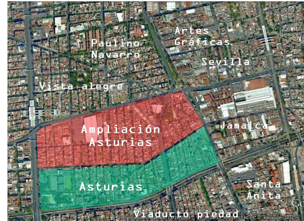
Colonias. Vista satelital. La intersección entre el cruce de las avenidas Tlalpan San Antonio Abad, Eje 3 sur, la viga y Viaducto. Lugar de gran visibilidad y accesibilidad.

El 19 de agosto de 1905, Iñigo Noriega propuso urbanizar la entonces Colonia La Paz, desde Cuauhtemotzin hasta el Río de la Piedad y de la Calzada de San Antonio Abad hasta el Canal de la Viga. Basó su solicitud en un escrito promovido en 1903.