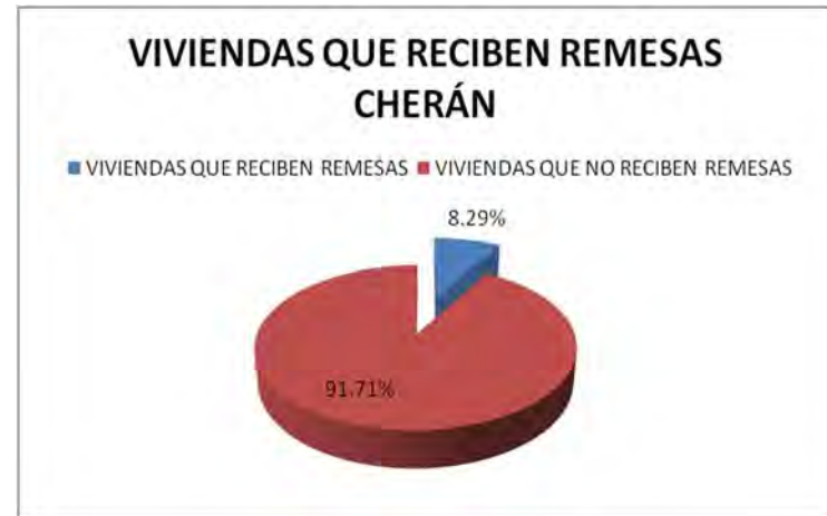
Gráfica 3.6 Viviendas que reciben remesas Cherán.