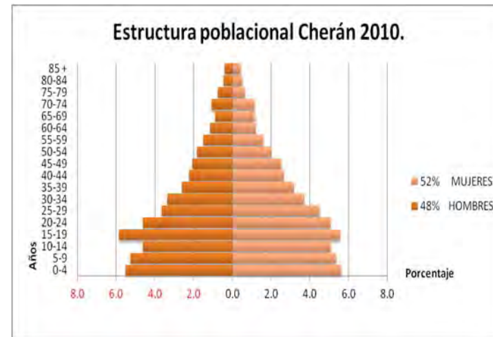
Gráfica 3.2 Estructura poblacional de Cherán.