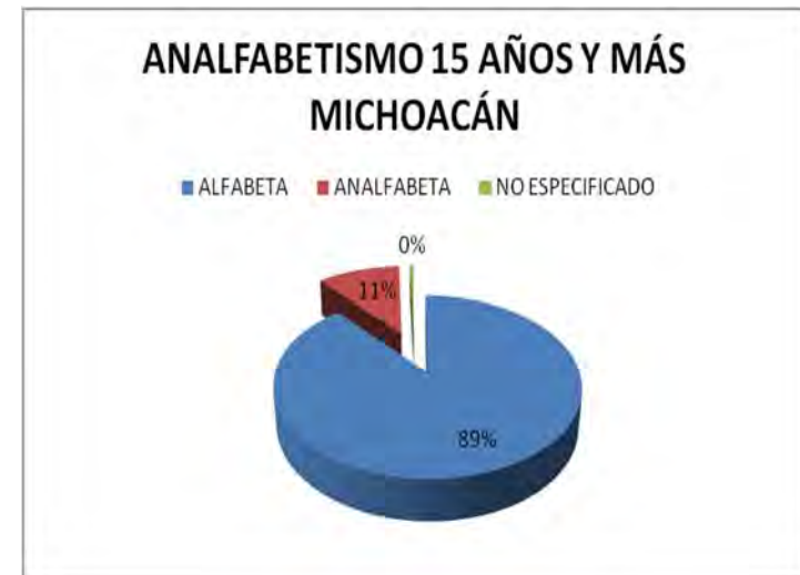
Gráfica 3.3 Analfabetismo, Estado de Michoacán.