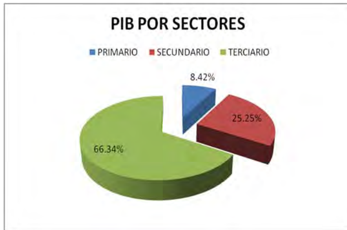
Gráfica 3.9 PIB por Sectores a nivel Municipal.

Para las proyecciones a futuro será necesario considerar la visión de la comunidad, respecto a la explotación de sus recursos para que de esta manera se generen programas que respondan a sus necesidades y respeten su planteamiento y así generar un incremento en el PIB.