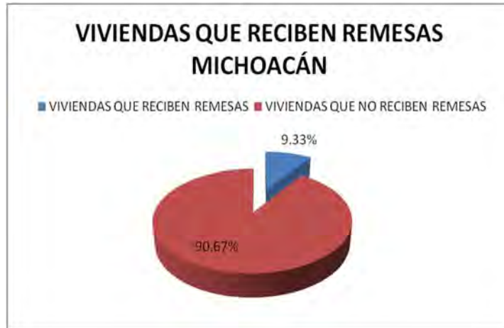
Gráfica 3.5 Viviendas que reciben remesas Michoacán.