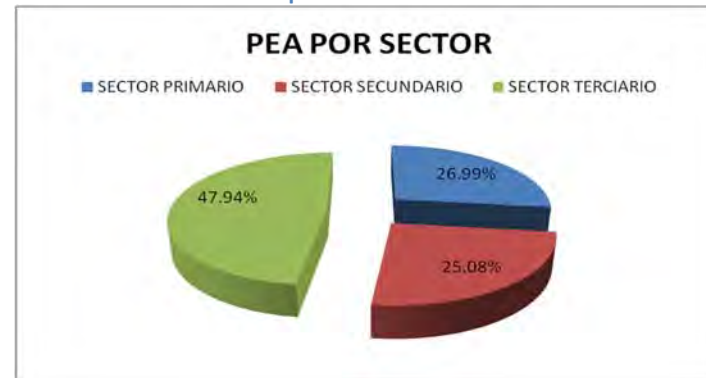
Gráfica 3.8 PEA de Cherán por sector.