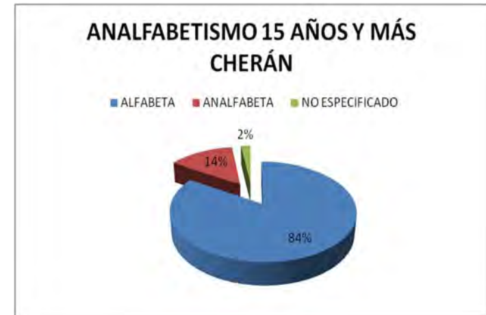
Gráfica 3.4 Analfabetismo, Estado de Michoacán.