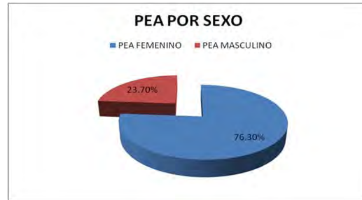
Gráfica 3.7 PEA de Cherán por sexo.