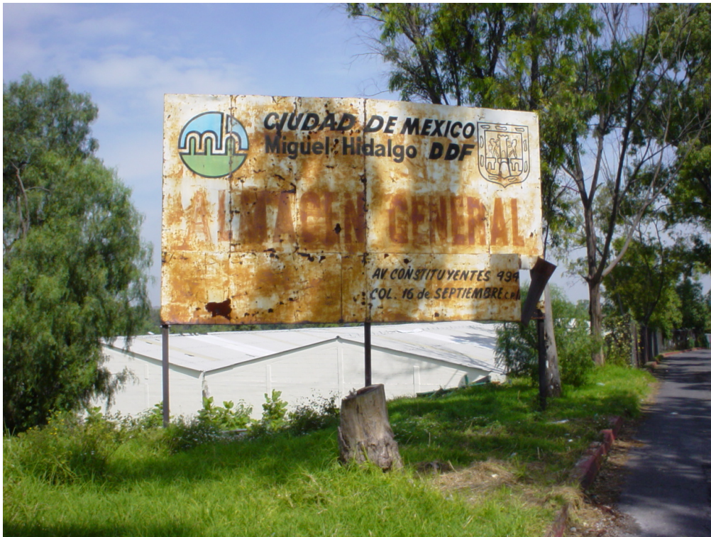
Fig. 112: Letrero Monumental en el límite de la Sección de Intelectuales y Científicos con la Zona Federal en el interior del Panteón Civil de Dolores.

Otro de los elementos que se encuentran presentes dentro del equipamiento urbano y en relación con la señalización es la presencia de letreros de carácter monumental. En la ciudad la mayoría de las veces son letreros publicitarios. En el interior del panteón existe un letrero monumental en el límite de la Sección de Intelectuales y Científicos con la Zona Federal (Fig. 112) que a diferencia de los comunes publicitarios, tiene el fin de señalar el almacén general.