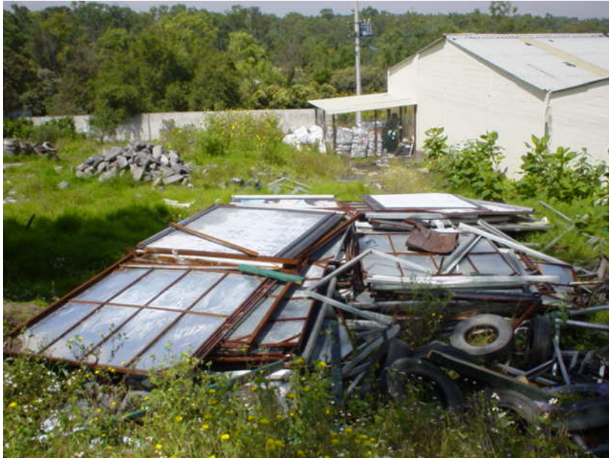
Fig. 124: Al fondo del lado izquierdo, se puede observar una pila de neumáticos viejos. En la parte central se observan piedras de mampostería y al frente de la imagen se ve diferentes desechos de láminas, tubos y neumáticos viejos.

En las figuras 125 y 126 se pueden ver dos camionetas chocadas que fueron dejadas, según entrevista con los trabajadores de vigilancia, por las mismas autoridades de la Delegación Miguel Hidalgo, por este motivo, la administración del cementerio no puede retirarlas del lugar.