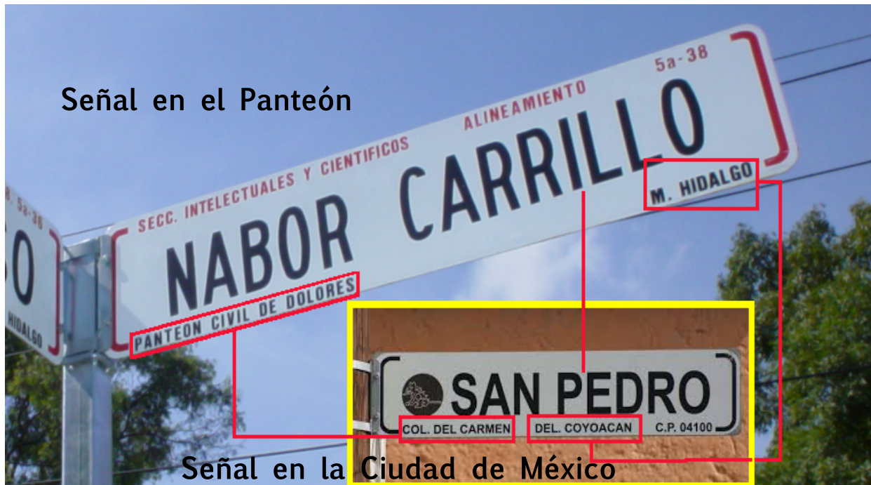
Fig. 111: Señalización utilizada en el Panteón en comparación con una señalización de una calle en la Ciudad de México.

La señalización dentro de la Ciudad de México por lo regular se encuentra en el cruce de las calles indicando el nombre de cada una de ellas, igualmente en el panteón encontramos estas señalizaciones en el cruce de las calles indicando el nombre correspondiente. El formato de los letreros de señalización de las calles y avenidas utilizados por lo general en la ciudad consta de los siguientes elementos: Nombre de la calle, colonia a la que pertenece, Delegación Política en que se encuentra la colonia, Código Postal y el ícono representativo de la Delegación a la que pertenece.