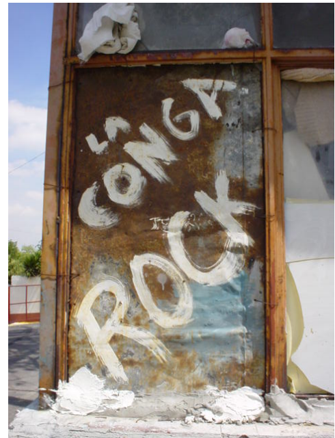
Fig. 123: Graffiti en una capilla de la sección de Intelectuales y Científicos.

Otro de los grandes problemas urbanos que se presenta con frecuencia en la Ciudad de México es la basura y chatarra que es dejada principalmente en predios que se encuentran a las orillas de la ciudad. El mismo fenómeno es localizado en el interior del panteón y no es de extrañar que, al igual que en la ciudad, estas zonas se encuentren justamente en las orillas del cementerio, en el límite de la última sección que es la de Intelectuales y Científicos y el muro que divide a la Zona Federal del panteón (Fig. 124 a 126). Esta área no cuenta con sepulcros por encontrarse a un costado de lo que es el almacén general. Como se puede observar en la figura 135, se encuentran acumulados en esta zona láminas, neumáticos viejos, piedras de construcción y escombros. La mayoría de estos objetos son arrojadas ahí por los mismos empleados del cementerio y suelen ser los materiales utilizados para los distintos trabajos realizados en el panteón, pero que después de algún tiempo que son desechados.