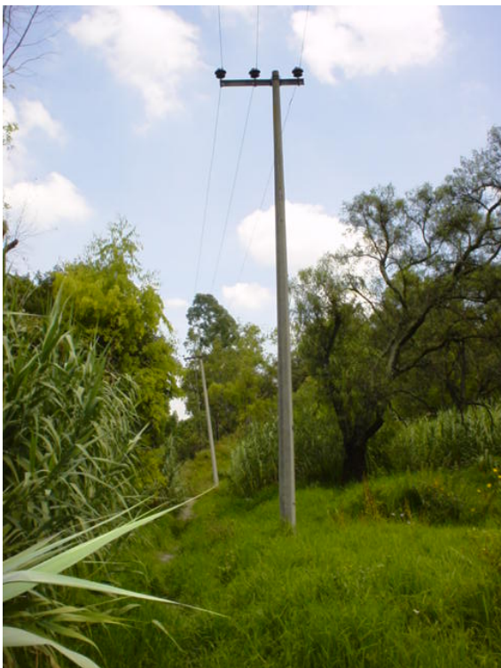
Fig. 115: Poste de Luz en el interior del Panteón Civil de Dolores.