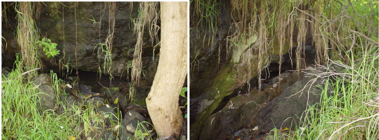
Figs. 103 y 104: Entradas a una de las cuevas que se encuentran en el barranco.