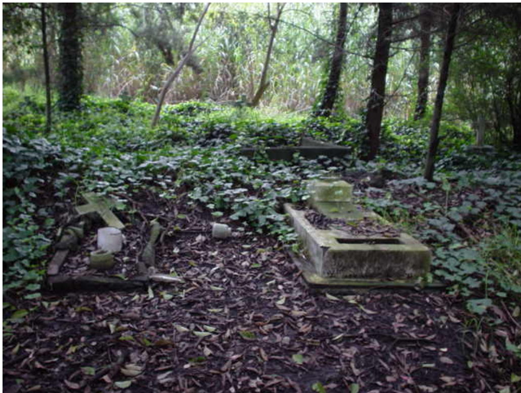
Fig. 105: Sepulturas localizadas en la Zona Federal. Parte más alta del terreno.

Para el levantamiento realizado al cementerio en el año de 1975 33 , esta zona contaba con un total de 33 lotes que se distribuyen de la siguiente forma: un lote de tercera clase, un lote de cuarta clase, 29 lotes de quinta clase y dos lotes particulares (Fig.101). Es fácil distinguir que esta zona es la que cuenta con el mayor número de lotes de quinta clase y carece de primera y segunda clase. Esto es probable a que se deba a un fenómeno paralelo existente en la ciudad, que es la poca demanda existente en los predios que se encuentran a las orillas de la ciudad, ya que no pertenecen a zonas de los suburbios y tampoco a las zonas