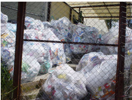
Fig. 117: Zona del almacén general dónde colocan bolsas de plástico con latas de refresco y envases PET.