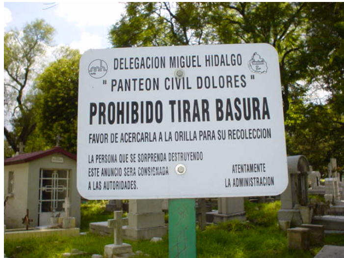
Fig. 114: Letrero de prohibición en el interior del Panteón.

Al igual que en las ciudades de la actualidad, el panteón cuenta con una área asignada para la separación de basura haciendo una clasificación de aquella que puede ser reciclada. Esta área se encuentra localizada junto al almacén general (Fig. 117). Lo que realmente no se pudo determinar es si este almacenamiento de materiales reciclables lo han hecho como parte del programa de limpieza del cementerio o la Delegación Miguel Hidalgo utiliza este espacio con un fin determinado, como se verá más adelante en unos casos específicos.