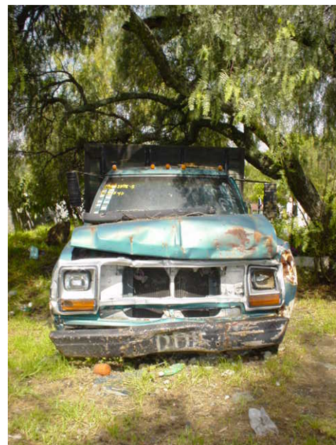
Fig. 125 y 126: Camionetas abandonadas en el área del almacén general del Panteón Civil Dolores.