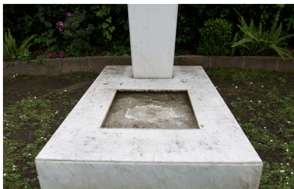
Fig. 118: Este sepulcro anteriormente contenía una placa indicando los datos de la persona ahí enterrada. Se desconoce si fue retirada por los dueños para su reparación o fue robada para su venta.