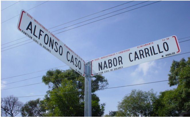
Fig. 110: Señalización de calles en el interior del panteón.

Uno de los aspectos que se ha destacado en este cementerio es el nombramiento de calles de manera paralela a la de la ciudad y el nombramiento de las zonas a manera de colonias. Ambos elementos –el nombramiento de calles y de secciones-, quedarían en una simple organización a niveles administrativos si no fuera por el hecho que existe en todo el panteón una señalización propia de la urbe (Fig. 110) que refuerza esta imagen de metrópolis.