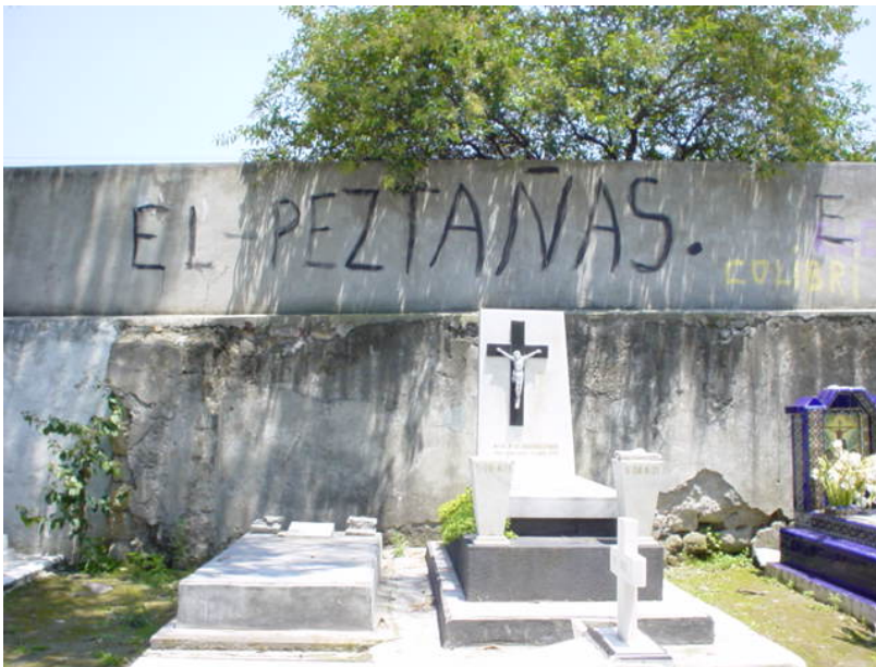
Fig. 122: Graffiti en el muro interior al panteón.

Uno de los aspectos de abordaje en este estudio ha sido el deterioro urbano que tiene el panteón, es necesario aclarar que el aspecto de deterioro no está enfocado al estado de mantenimiento o deterioro de los sepulcros o monumentos, está enfocado principalmente a los aspectos comunes en una urbe, como son la contaminación visual, áreas abandonadas con tiraderos, vandalismo, etc., que, como cualquier ciudad, el panteón presenta en diferentes espacios. Uno de los deterioros más comunes son los graffitis al interior del cementerio. Estas pintas aparecen de un día a otro y son retiradas por la administración lo más inmediato posible (Fig. 122 y 123). Pueden encontrarse en muros perimetrales, en pequeñas bodegas de los trabajadores e incluso en algunas capillas.