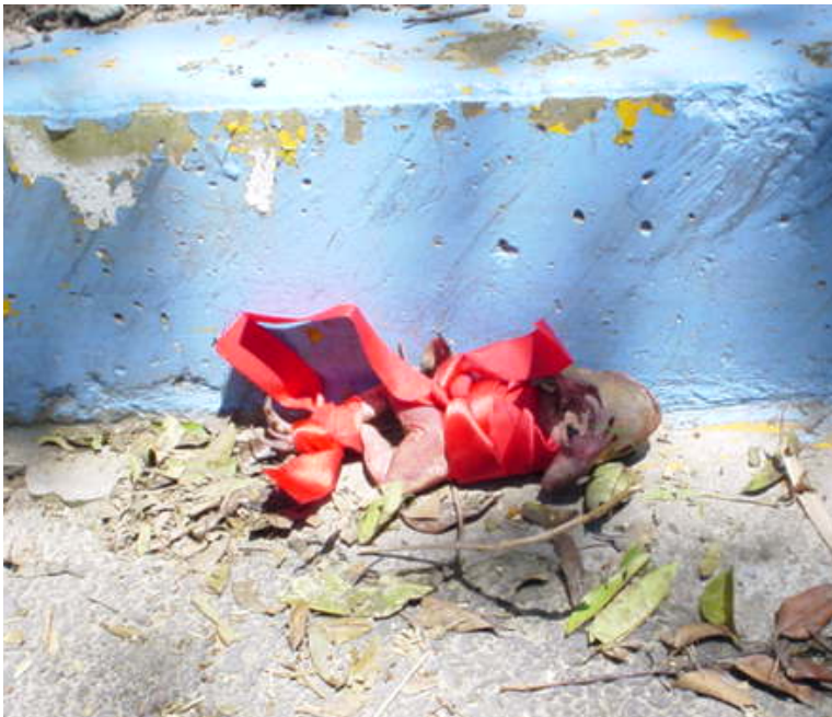
Fig. 109: En esta imagen se puede observar una rana envuelta en un listón rojo que ata las patas del animal. El día que se tomó esta foto era luna nueva, la rana estaba colocada con la cabeza al oriente y sobre un libro tallado en mármol en un sepulcro (antes de la toma de esta foto una persona pasó y derribó a la rana, de ahí que la imagen esté tomada en el suelo). En algunas tradiciones y creencia populares, según lo que se indagó al respecto, es un ritual de magia blanca en el cual una persona toma la altura de su pareja con el listón rojo y con él ata las patas de la rana, la sacrifica y deja sobre el libro de una tumba en luna nueva y viendo al oriente, todo esto para “atar a la persona” y que no pueda ésta terminar la relación.

De esta forma, podemos observar cómo el cementerio, en este caso el Panteón Civil de Dolores, se convierte en un espacio en dónde las expresiones de pensamiento que giran en torno a las creencias se ven representadas de muchas formas de manera plástica y que algunas de ellas, como el caso de las capillas en forma de templos religiosos, pueden emular, incluso, a los templos existentes en la ciudad, reproduciendo no solamente su arquitectura sino sus atrios y rejas de acceso.