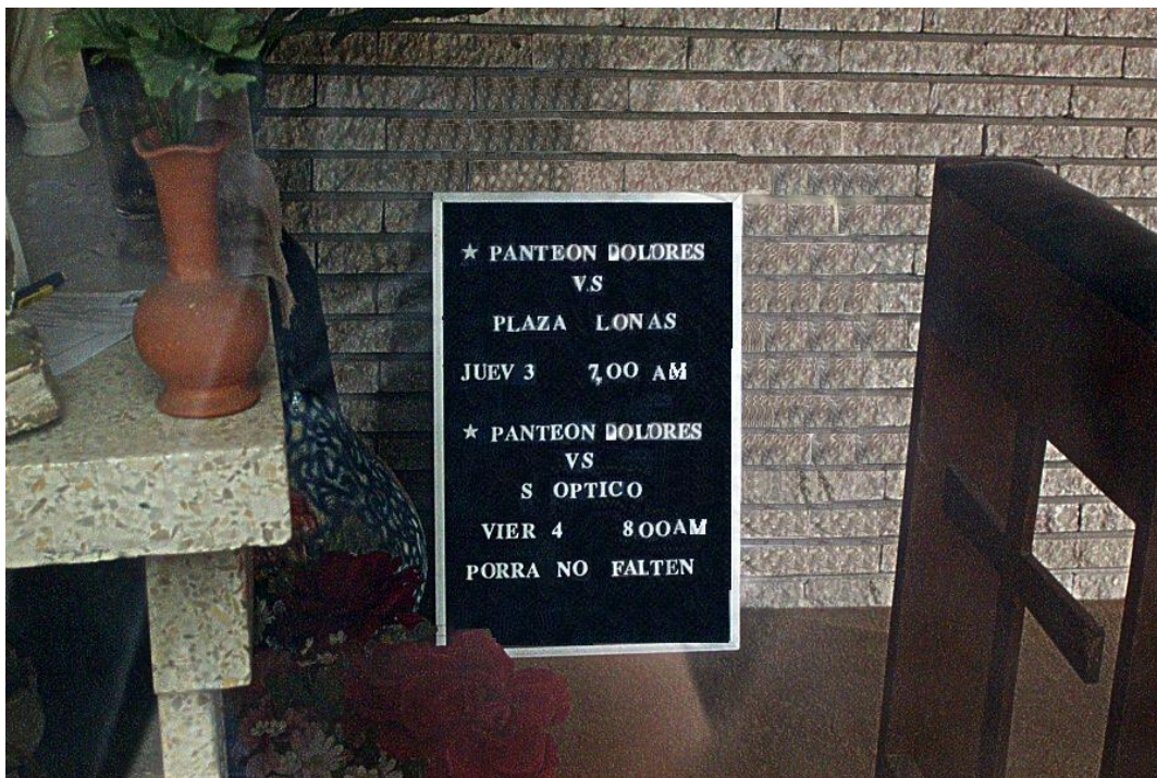
Fig. 107: Letrero de convocatoria para el partido de football. El letrero dice:

El Panteón Civil de Dolores, al ser una edificación especializada donde se albergan los restos humanos, evidentemente, cuenta con una carga de creencias e interpretaciones mágicas y religiosas muy unidas a la ciudad, pero también existen elementos de equipamiento urbano, delincuencia, deterioro urbano y organización laboral presentes que se irán describiendo.