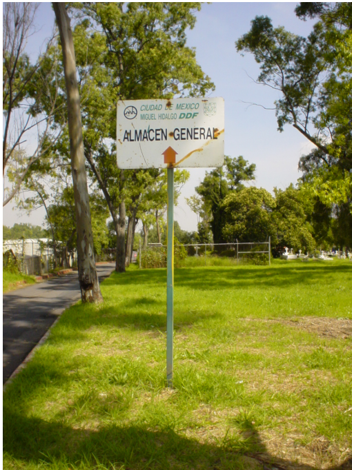
Fig. 113: Señal que indica la ubicación del almacén general dentro del Panteón.

casetas de vigilancia (Fig. 116). Cabe aclarar que las fotografías aquí presentadas en la actualidad se encuentran en la Zona Federal del panteón, pero que fueron realizados cuando esta sección pertenecía aún al cementerio, de ahí que se han tomado en cuenta como elementos de equipamiento urbano de éste.