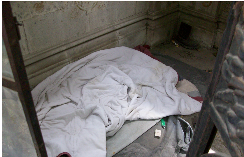
Fig. 121: Elementos encontrados en el interior del monumento de la familia Matías Romero.

Esta situación que se presenta en este monumento en específico, no es una excepción en el panteón, en otras visitas se han encontrado rastros muy similares en otros monumentos y criptas. Al realizar entrevistas al personal de seguridad del panteón, me indicaron que esto era una situación a lo que cotidianamente se enfrentaban debido a que al ser tan grande el cementerio, era fácil que algún indigente o que algún trabajador de los auxiliares se quedara en algún monumento a dormir sin que ellos se