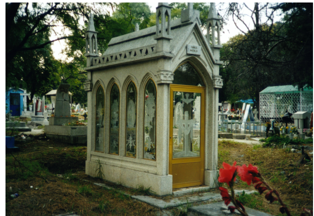
Fig. 108: Grupo de Capillas de diferentes épocas en el interior de Panteón Civil de Dolores que representan pequeñas iglesias.