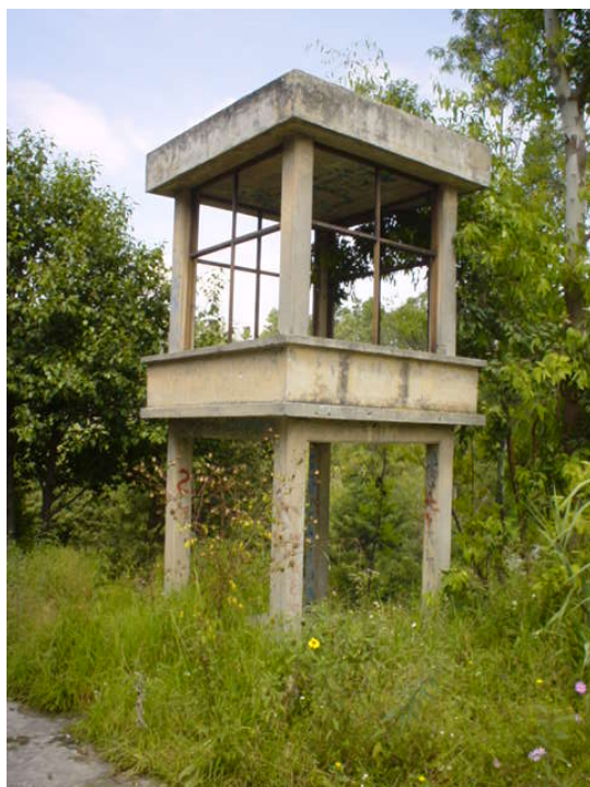
Fig. 116: Caseta de vigilancia en el interior del Panteón Civil de Dolores.