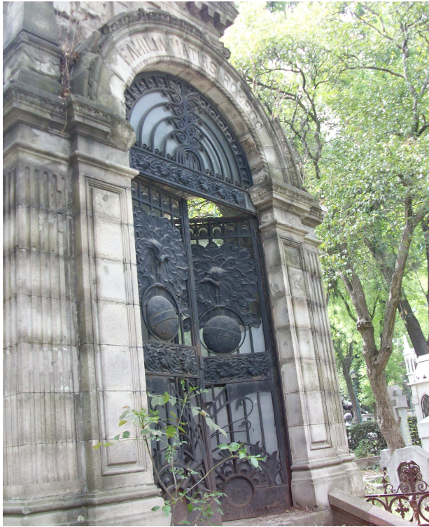
Fig. 119: Monumento de la familia Matías Romero en el Panteón Civil de Dolores.