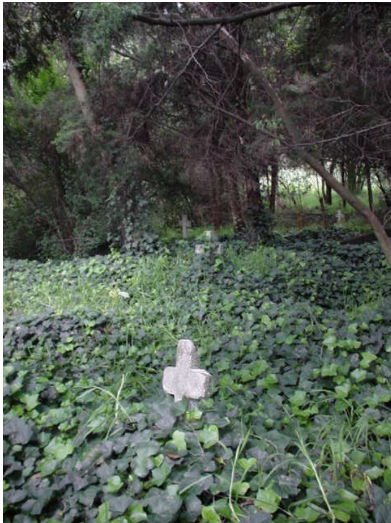
Fig. 106: Sepulturas localizadas en la Zona Federal. Parte más baja del terreno.

Un elemento curioso a destacar en esta zona, es que el muro divisorio que hizo que la Tercera Traza se dividiera por la mitad, también hizo que los lotes particulares se integraran de forma no natural a otras secciones del cementerio, como sucede con los lotes Ortíz Rubio que se integró a la sección de Militares y e Lote de Panaderos que se integró como un apéndice a la sección de Bellas Artes.