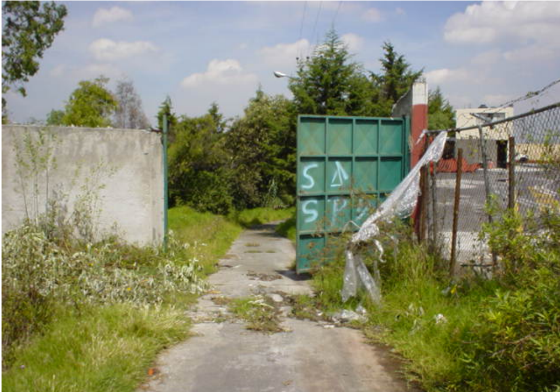
Fig. 102: Puerta de acceso desde el panteón a la Zona Federal.

Esta situación llevó a la administración del panteón a reforzar la vigilancia en esta zona y en general en todo el cementerio, de tal suerte que si localizan a alguna persona con cámara fotográfica o de video, la mantienen muy vigilada y le piden que guarde su(s) cámara(s) hasta llevar un oficio a la Dirección de Cementerios y Panteones de la Delegación Miguel Hidalgo solicitando autorización para sacar fotos o video en el interior de panteón y explicando sus motivos para hacerlo. En esta zona los sepulcros que aun existen carecen de mantenimiento por parte de la administración del panteón, por otro lado, tampoco pueden ser tocados por la coordinación de Jardines y Parques Nacionales debido a que son propiedad privada al encontrarse en el régimen de perpetuidad (Fig. 103 a 106). Al parecer no han sido reclamados por los familiares de las personas ahí enterradas.