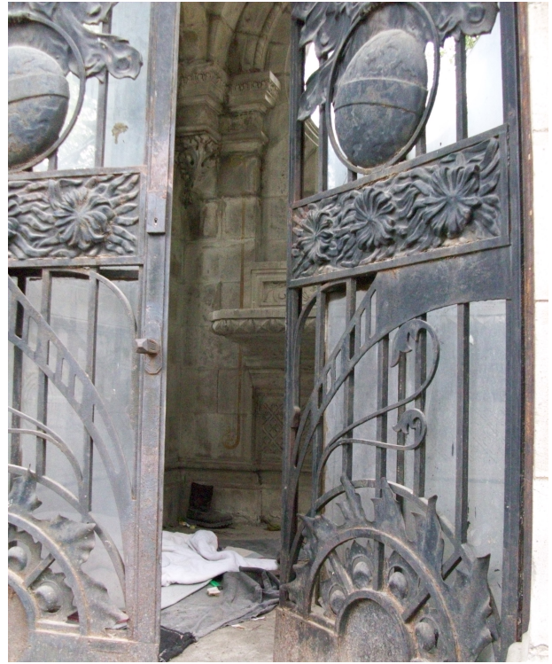
Fig. 120: Acceso al Monumento de la familia Matías Romero.