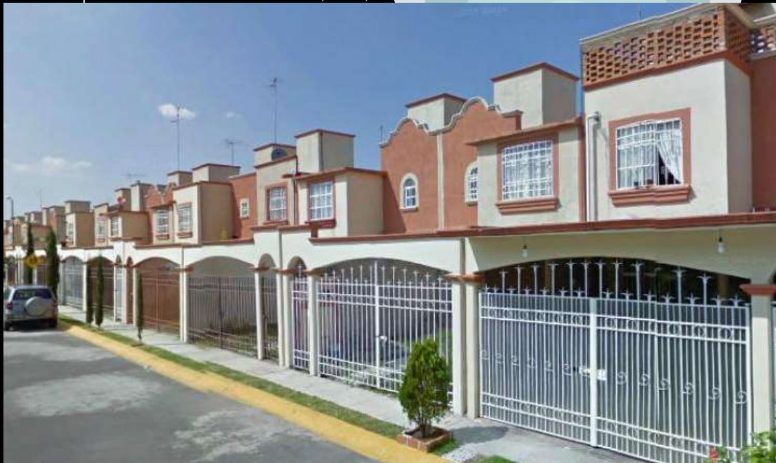
VISTA AEREA CONJUNTO LAS AMERICAS

Se solicito la autorización para la creación de un conjunto urbano tipo mixto (habitacional de interés social y popular, industrial, comercial y de servicios) denominado “Las Américas” para desarrollar viviendas. La colonia está conformada por 13,000 Viviendas, de las cuales 7388 son de tipo popular y 5612 de interés social, en una superficie de terreno de 3,410,580.737 m 2