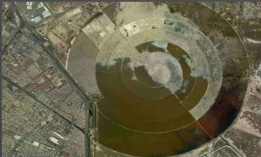
VISTA AEREA DEL CARACOL.

"El Caracol de la Ciudad de México", es un embalse de agua formado por un sedimento del Lago de Texcoco, situado al sureste del predio a intervenir, tiene una forma parecida a un enorme caracol, de unos 3.200 metros de diámetro. Sirve para abastecer de agua industrial a las localidades cercanas y partes de la Ciudad de México.