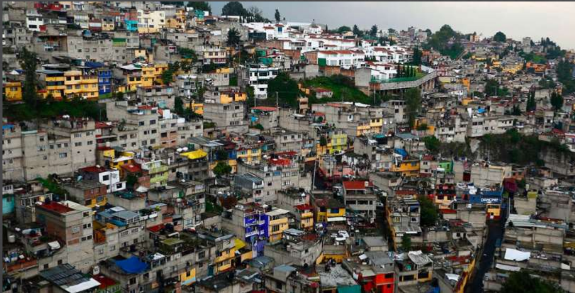
VISTA AEREA DEL VIVIENDAS EN ECATEPEC

Entre las empresas que aprovecharon estas facilidades se encuentran Ara, Sadasi, Geo, Beta, Urbi o Hir, promoviendo que en menos de diez años surgieran alrededor de setenta unidades habitacional en la zona, con esto se cree que llegaron al Estado de México por lo menos 400, 000 nuevos habitantes y con ellos todas las problemáticas que eso significa.